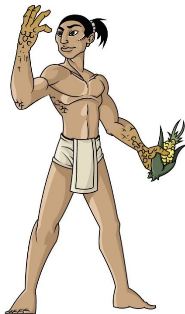
Hombre de maíz