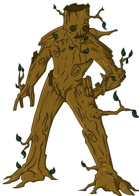
Hombre de madera