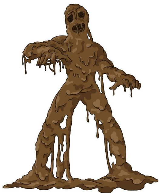
Hombre de barro

Algunas de estas explicaciones nos han llegado de culturas como la griega, romana, maya, azteca e inca. Las personas se hacían preguntas acerca de temas como el origen de los seres humanos, la muerte, el bien, y el mal, la fundación de los pueblos; y creaban historias en las que de alguna manera respondían a esas interrogantes. Por ejemplo, El Popol Vuh, libro del pueblo maya quiché, narra que el ser humano fue hecho de maíz.